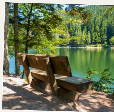
Banc au bord du lac des Corbeaux

Location de poussettes tout terrain à la résidence "Le Couarôge" (vallée de Vologne).